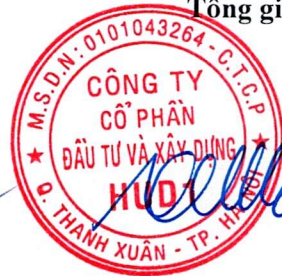
Lê Thanh Hải